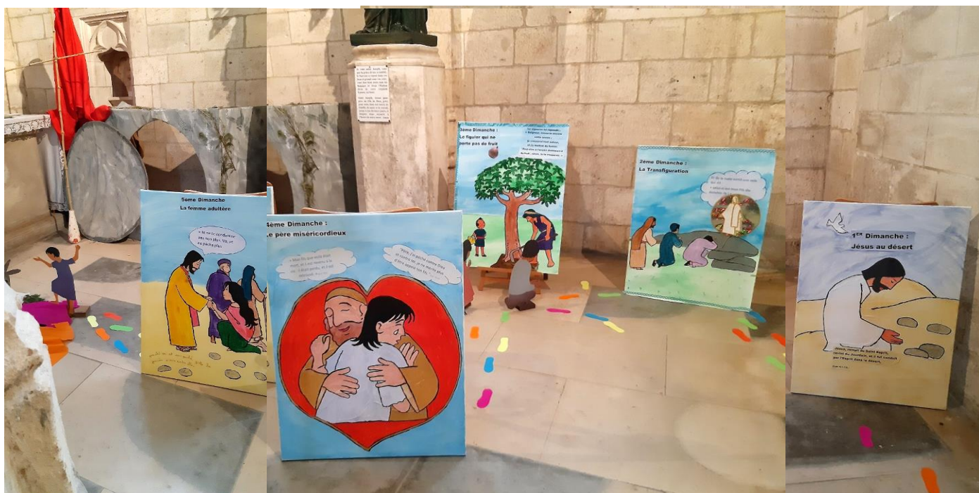
Illustration des évangiles du Carême jusqu'au tombeau...

Prions, louons et glorifions le Seigneur, notre Dieu et Père, pour toutes les grâces offertes et reçues en ce saint mois de Mars.