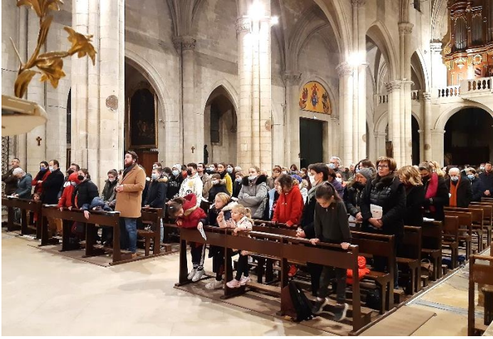
La messe des Cendres a été concélébrée par le

En ce mercredi soir, les fidèles paroissiens sont venus nombreux prier le Seigneur et recevoir les cendres.